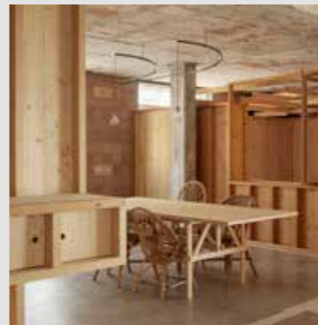
CAN GABRIEL TED'A arquitectes