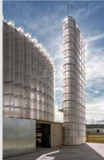
CENTRAL TÉRMICA DE DH ECOENERGÍAS FRPO Rodríguez & Oriol estudio