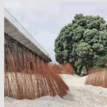
ACONDICIONAMIENTO DEL BORDE DE LA PLAYA CREUS&CARRASCO + RVR Arquitectos