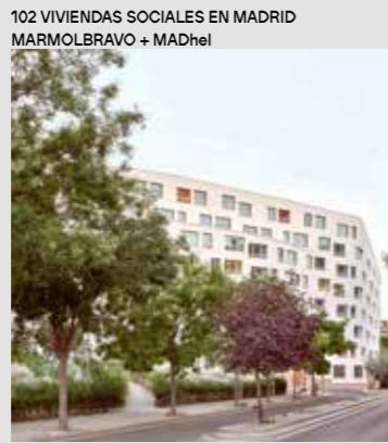
102 VIVIENDAS SOCIALES EN MADRID MARMOLBRAVO + MADhel