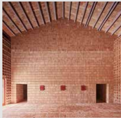
REHABILITACIÓN ESPACIO POLIVALENTE Y CULTURAL Camps Felip Arquitecturia