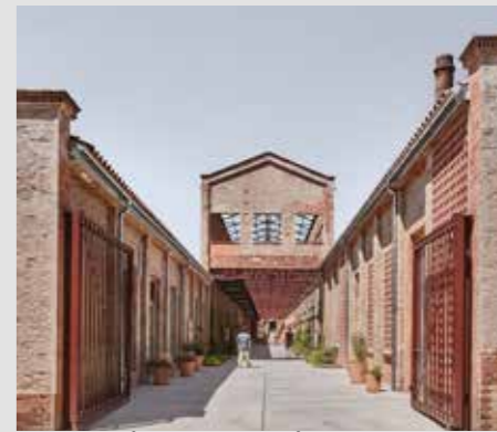
REHABILITACIÓN DEL VAPOR CORTÉS. PRODIS 1923 H ARQUITECTES