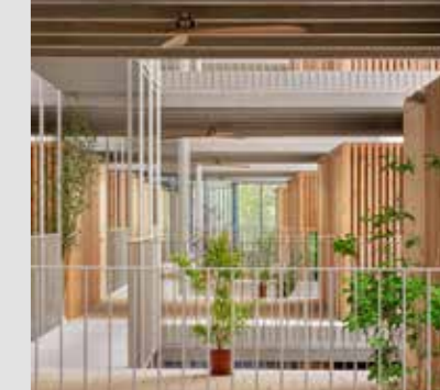
GREENH@USE. 140 VIVIENDAS SOCIALES DE ALQUILER Marta Peris, José Toral + Jaime Pastor