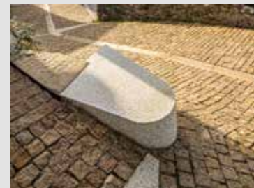
REHABILITACIÓN ESPACIO PÚBLICO DE NEBRA Carlos Seoane