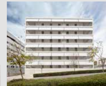
30 VIVIENDAS DE PROTECCIÓN OFICIAL DATAAE + Xavier Vendrell studio