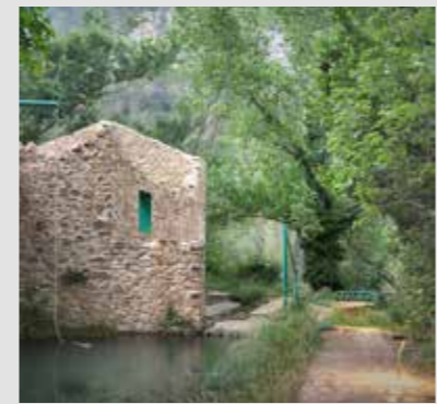
EL CAMINO DE LA ALMAZARA Carpe Estudio + PlanoPlano Estudio + Miguel Hernández