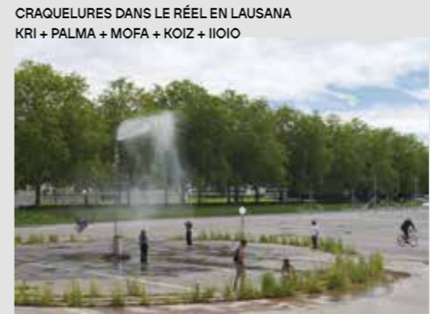
CRAQUELURES DANS LE RÉEL EN LAUSANA KRI + PALMA + MOFA + KOIZ + IIOIO