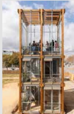
REGENERAR BARCELONA REARQ [UPC] + GICITED [UPC] + Constraula - Sorigué