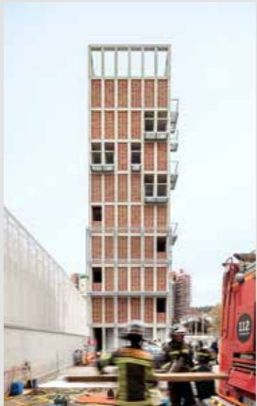
TORRE DE BOMBEROS EN VALL D'HEBRON Carles Enrich Studio