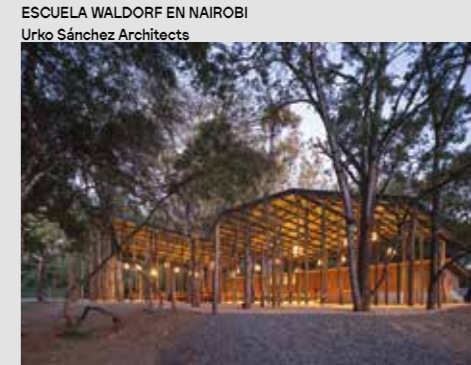
ESCUELA WALDORF EN NAIROBI Urko Sánchez Architects