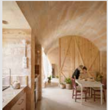
MAPA DE RECURSOS / SVPP EN SANTA EUGENIA Carles Oliver + Xim Moya