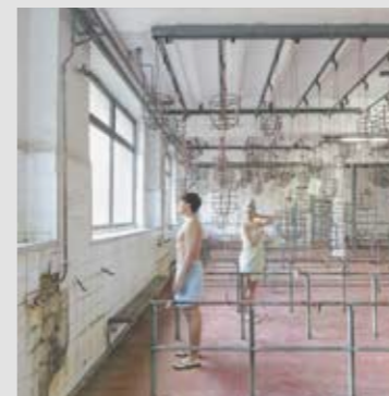
EL CARBÓN, DE LA EXTRACCIÓN A LA ATRACCIÓN longo + roldan + Ana Amado