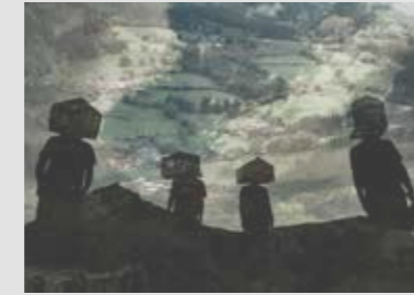
MASCARADA Elearkitektura + Pablo Miranzo