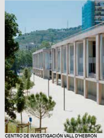
CENTRO DE INVESTIGACIÓN VALL D'HEBRON BAAS arquitectura + Espinet/Ubach arquitecte