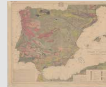
LA HUELLA HUMANA EN LOS SUELOS Montserrat Bonvehí + Seth Denizen