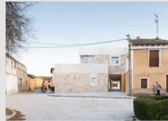
CASA CONSISTORIAL DE VALVERDE DE CAMPOS Óscar Miguel Ares