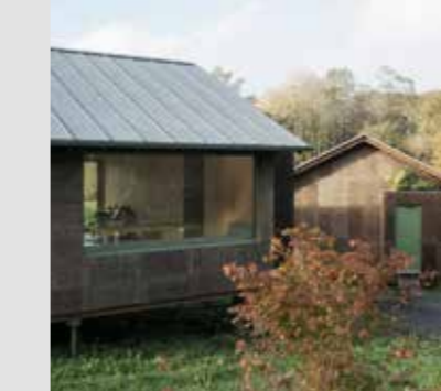
CASA ID Y TALLER GRAU rellam | architecture