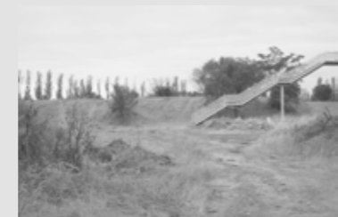
LA POTENCIA ESTRATÉGICA DEL VACÍO nUNDO + Catara Rego