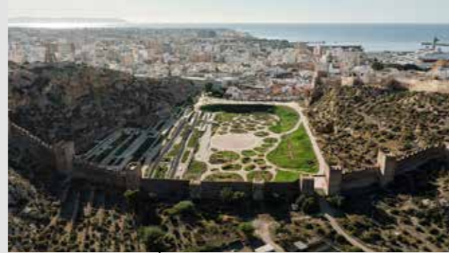
PARQUE JARDINES MEDITERRÁNEOS DE LA HOYA Kauh Arquitectos